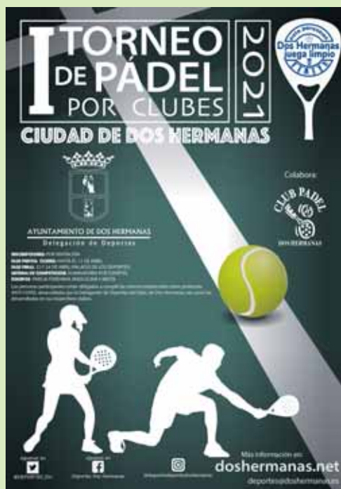
Cartel del I Torneo de Pádel por Clubes 'Ciudad de Dos Hermanas'.

Para más información: www.doshermanas.net