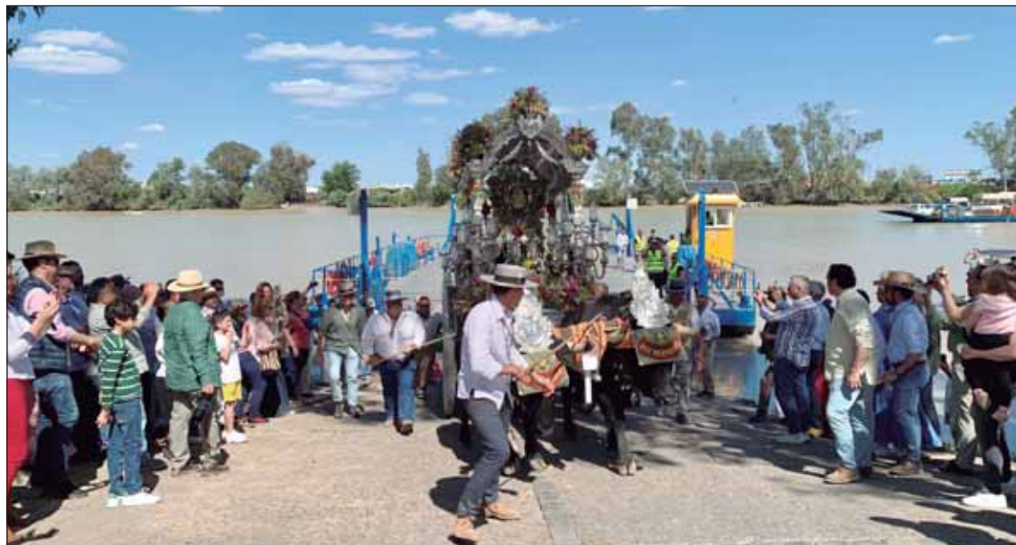
La Hermandad del Rocío nazarena ya está camino de la Aldea almonteña.

un edificio de viajeros, dos andenes y un paso inferior accesible para conectarlos. Se convertirá en un intercambiador de transportes.