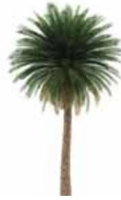
Palmera de California