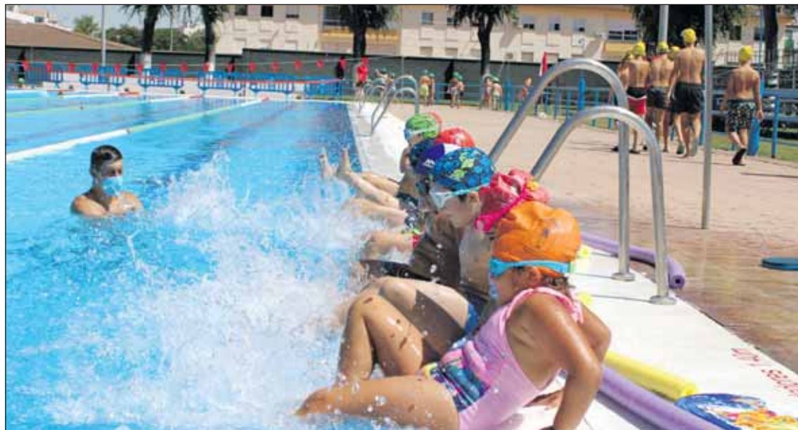
La temporada de piscinas para el baño recreativo comienza el próximo lunes.

corte de jamón, etc. Los comercios permanecerán abiertos hasta las 22.00 horas para facilitar las compras de todos los clientes.