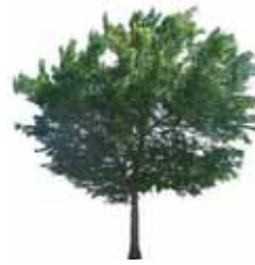
Olmo de Siberia