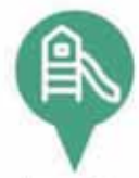
Área de juegos infantiles