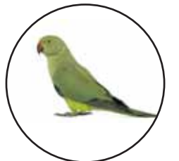
Cotorra de Kramer

Dos Hermanas tiene parques y jardines con ejemplares de árboles y arbustos muy valiosos, tanto por su antigüedad, rareza y cualidades estéticas, como por su valor histórico. Además cuenta con actividades y servicios que te harán disfrutarlos aún más. ¡Vívelos!