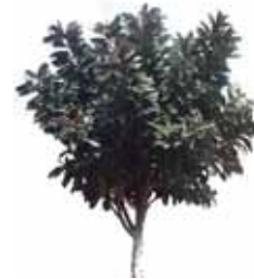
Árbol del Caucho