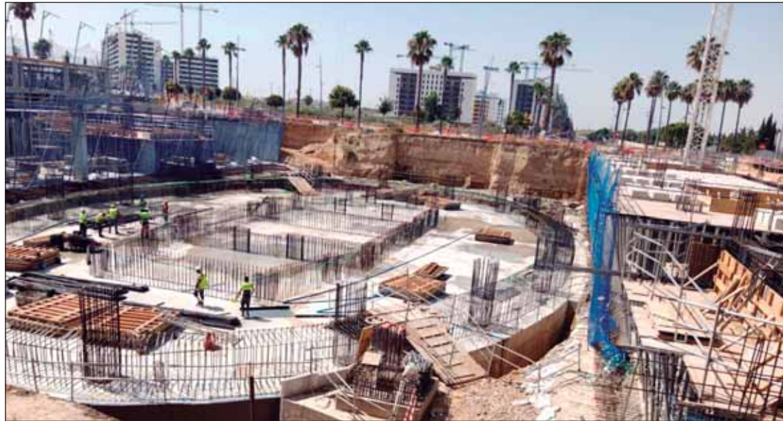
La primera fase de la Torre de Entrenúcleos finalizará a principios de 2025.

por invitación que se puede recoger desde hoy. Camela actuará en la ciudad el día 27. Las entradas están a la venta en bclever.