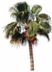
Palmera de California