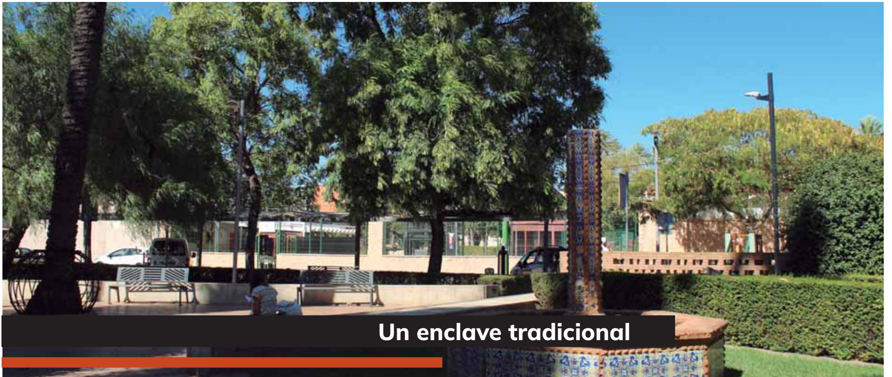
Un enclave tradicional