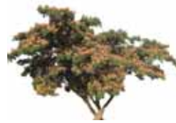
Árbol de la seda