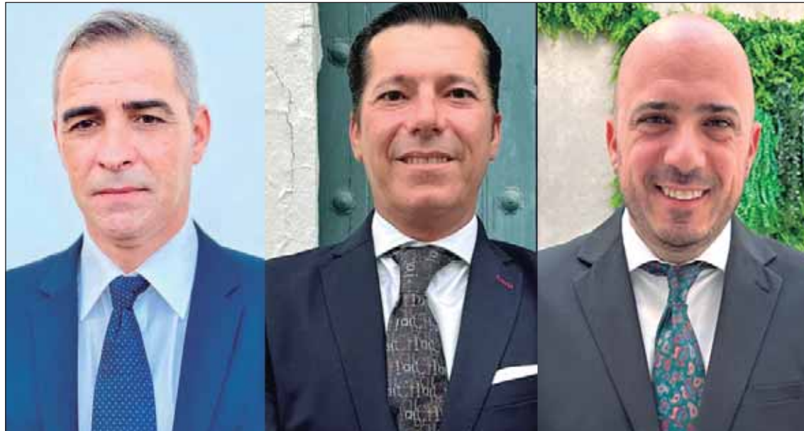
La Cabalgata designa a los personajes para el desfile del próximo día 5 de enero.

trabajo: '¡Que la música te acompañe!'. Aún quedan entradas para disfrutar del espectáculo y se pueden adquirir a través de bclever.