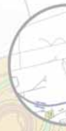
Carretera de la Isla

Obras ejecutadas por el Ayuntamiento de Sevilla relativas al Programa de Recuperación, Transformación y Resiliencia (NextGenerationEU) en el marco del Plan de Recuperación, Transformación y Resiliencia. Financiado por la Unión Europea.