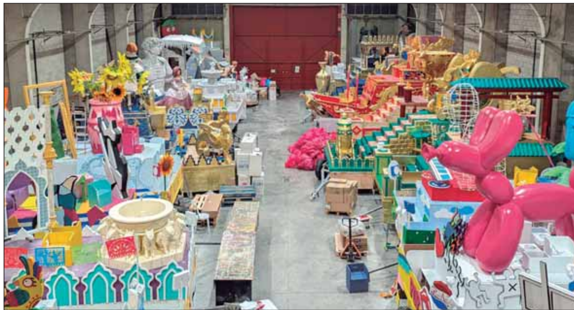
Los Reyes Magos de Oriente están a punto de llegar a la ciudad para la Cabalgata.

bre de 2025 algo que permitirá aliviar la economía de las familias nazarenas y favorecer su uso contribuyendo a la sostenibilidad ambiental.