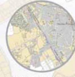
Avenida 4 de Diciembre Antigua N IV