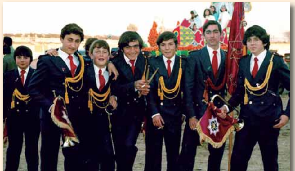
Con buen humor, posan ante la cámara siete miembros de la Banda de Cornetas y Tambores de La Estrella, una de las que acompañarán al desfile.