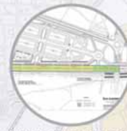
Aparcamiento disuasorio Avenida de la Libertad

Obras financiadas por la Unión Europea. Recuperación, Transformación y Resiliencia (Ministerio de Transportes y Movilidad Sostenible) cofinanciadas por el Ayuntamiento de