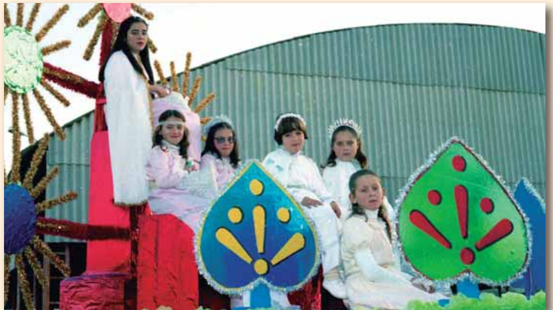
Seis angelitos componen esta carroza infantil, exornada con flores de papel, cartones forrados y elementos de papelería. Al fondo, nave de León y Cos.