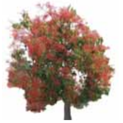
Árbol de Fuego