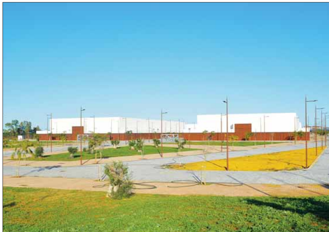
El Palacio de Exposiciones y Congresos se inaugurará a principios de 2026.

La fiesta de Don Carnal llega a Dos Hermanas a partir de mañana con el Concurso de Agrupaciones. El edificio multifuncional de Canteley acogerá durante todo el fin de semana las actuaciones de las agrupaciones, chirigotas y comparsas, en la fase de semifinales. La entrada para disfrutar de las actuaciones es libre y gratuita hasta completar aforo. El concurso comenzará mañana viernes a las 20.00 horas. El sábado seguirán las semifinales comenzando también las actuaciones a las 20.00 horas. Y, el domingo, se cerrará la fase de semifinales a partir de las 18.00 horas. Tres comparsas y tres chirigotas pasarán a la gran final del concurso que se celebrará el sábado, día 15 de febrero, a las 20.00 horas, en el Teatro Municipal Juan Rodríguez Romero. La entrada será por invitación a través de Groupon.