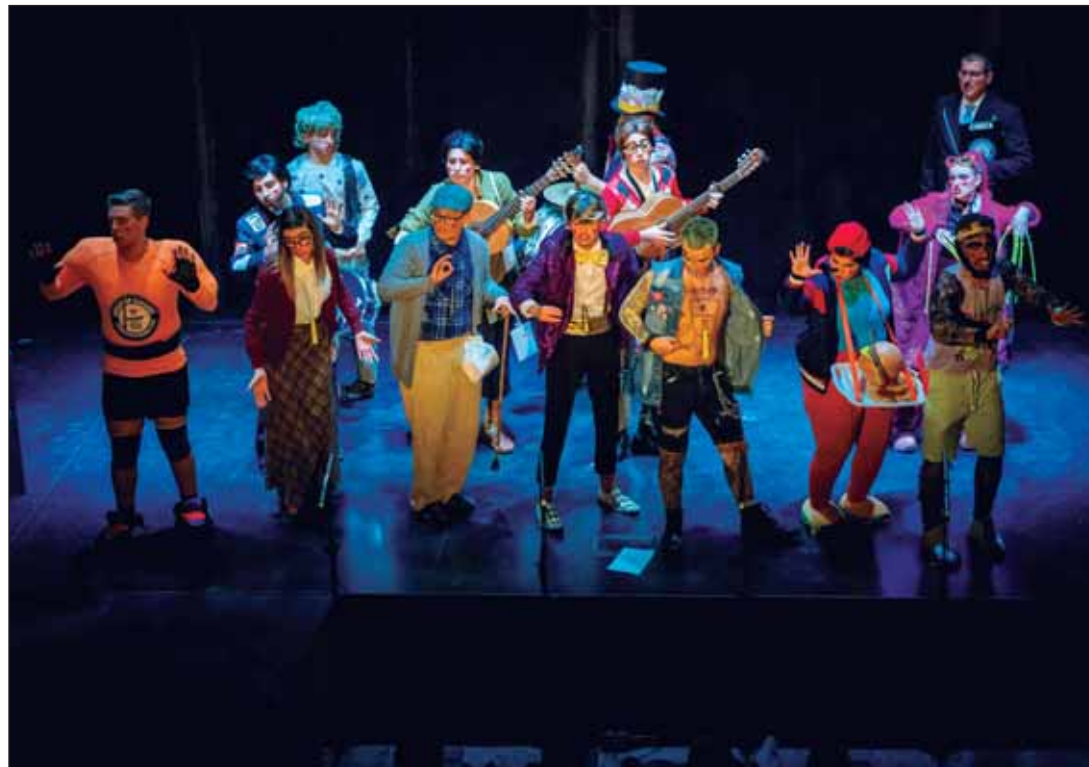
Pregón, final del Concurso de Agrupaciones y Domingo de Coplas, este fin de semana.

El domingo, a las 10.00 horas, se celebra una nueva edición del Día de la Rueda en la que puede participar toda la ciudadanía. No es necesaria inscripción previa sólo acudir con su bicicleta o cualquier medio de desplazamiento sobre ruedas (patines, patinetes, etc.) no motorizado. La salida y la llegada de esta marcha lúdica se realizará desde el parque de La Alquería. Se trata de una actividad que tiene por objeto fomentar el uso de la bicicleta y otros medios de desplazamiento sobre ruedas que no posean motor eléctrico, así como promover la práctica de la actividad física saludable, la movilidad y el transporte activo y sostenible. Tras llegar la marcha de nuevo al parque de La Alquería se sortearán 12 bicicletas y habrá actividades lúdico-deportivas para disfrutar en familia.