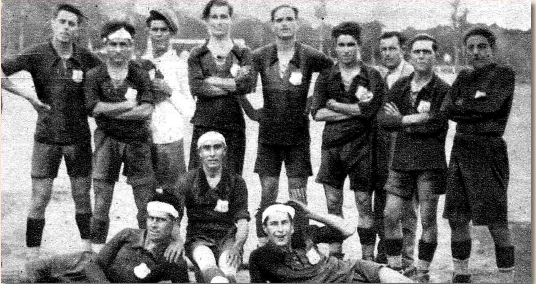
Única fotografía conocida del Club Deportivo Dos Hermanas, equipo de nuestro pueblo en el periodo republicano.