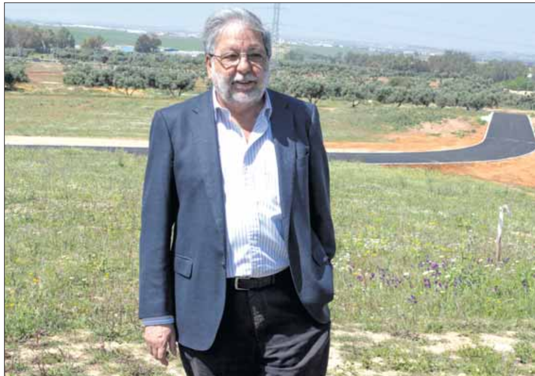
Medalla de Oro y nombramiento como Hijo Adoptivo y Predilecto de Toscano.

El Carnaval 2025 se clausurará el sábado con la Gran Cabalgata que recorrerá las calles de la ciudad. En el pasacalles de este año participarán 10 carrozas. El recorrido que realizará la Cabalgata de Carnaval se iniciará en la barriada de Los Montecillos. A las 17.00 horas, el pasacalles partirá desde la calle Las Botijas, proseguirá por: Plaza Félix Rodríguez de la Fuente, calle Cristo de la Vera Cruz, calle Portugal, Avenida de Andalucía, Avenida Reyes Católicos, calle Burgos, calle Felipe II, Avenida de Los Pirralos, Avenida Cristóbal Colón, calle Santa María Magdalena, Plaza de la Constitución, calle Santa Ana y calle Real Utrera. Desde la calle Real Utrera, los participantes se dirigirán a la Plaza de El Arenal donde se celebrará una gran fiesta de clausura.