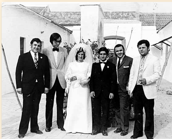
Siete familias, un patio